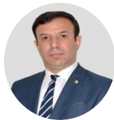
Reda TIR Président CONSEIL NATIONAL ÉCONOMIQUE, SOCIAL ET ENVIRONNEMENTAL