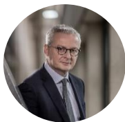
Bruno LE MAIRE Ministre de l'Économie, des Finances et de la Relance