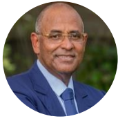
Patrick ACHI Premier ministre RÉPUBLIQUE DE CÔTE D'IVOIRE