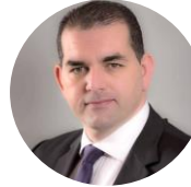
Sami AGLI Président CONFÉDÉRATION ALGÉRIENNE DU PATRONAT CITOYEN (CAPC)